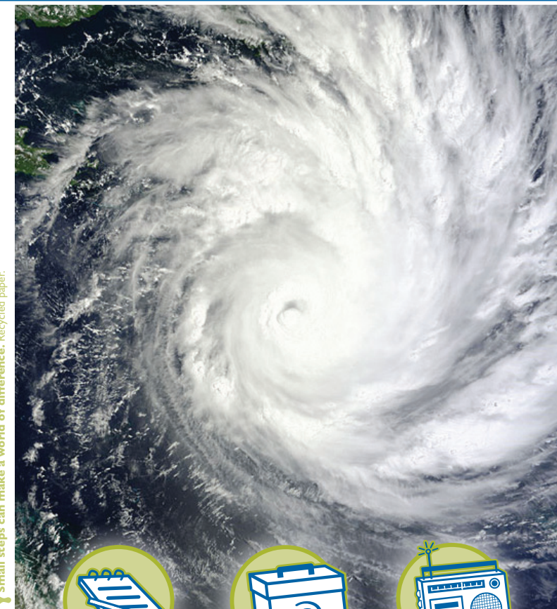
Small steps can make a world of difference. Recycled paper.